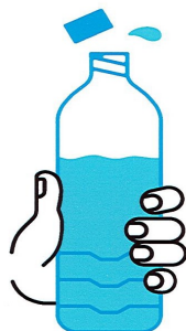
JE BOIS RÉGULIÈREMENT DE L'EAU